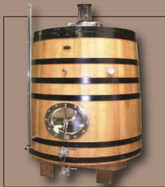
Analyse TCA&TCP disponible sur demande