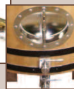
Option : Porte inox