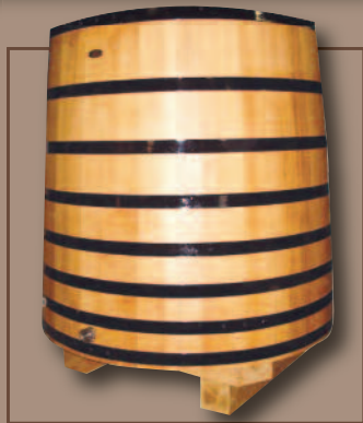
Analyse TCA&TCP disponible sur demande