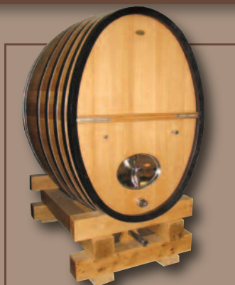
Analyse TCA&TCP disponible sur demande