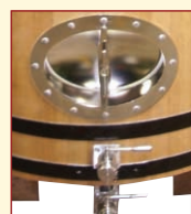
Option : Porte Inox